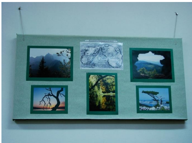
3. Fotografie (aut. E. Gawron) oraz mapa „Śródziemie i Nieśmiertelne Kraje”

Obraz (aut. Anna Gawron) zaprezentowany na wystawie idealnie wkomponowuje się w klimat „Silmarillionu” (choć nie był malowany z tą myślą).